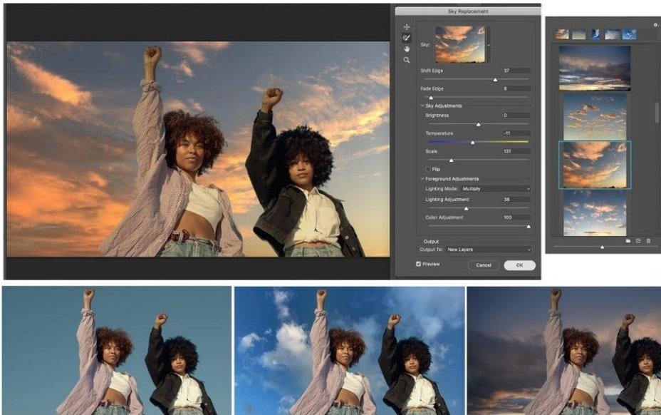
圖片 2：使用全新的天空替換功能從 Adobe 資料庫選取新的天空或者添加自己的天空