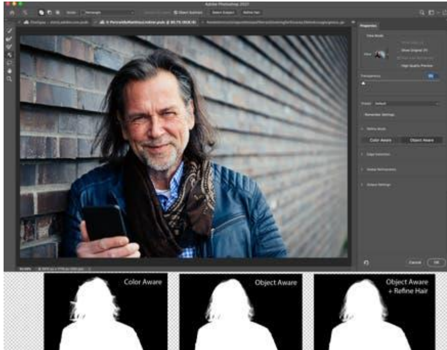
圖片 3：使用調整頭髮功能和物件感知調整模式自動提升頭髮的選取效果