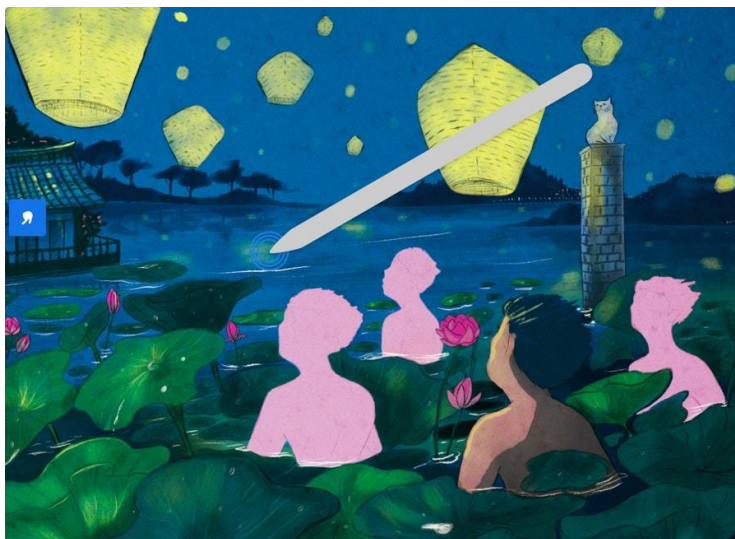
圖 3：Fresco 塗抹刷工具；藝術作品由 Nandita Pal 創作

此外，在 Adobe Capture 團隊的協助下，用戶也可在 Fresco 使用所有獨特的自訂筆刷。用戶能開啟像素筆刷選單搜尋自訂的筆刷資料庫。