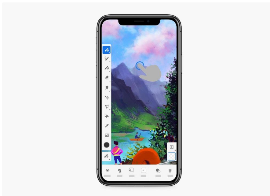
圖 1：Fresco iPhone 版本；藝術作品由 Jinjin Sun 創作

Fresco 現在也支援文字編輯功能，添加些許文字，除了錦上添花還能更豐富地傳達故事。而內建的滑桿也可用於調整大小、指引和追蹤，同時還有數千種 Adobe Fonts 字體可供選擇。