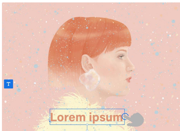
圖 2：Fresco 支援文字編輯功能；藝術作品由 Hsiao-ron Cheng 創作

Fresco 現在也支援文字編輯功能，添加些許文字，除了錦上添花還能更豐富地傳達故事。而內建的滑桿也可用於調整大小、指引和追蹤，同時還有數千種 Adobe Fonts 字體可供選擇。