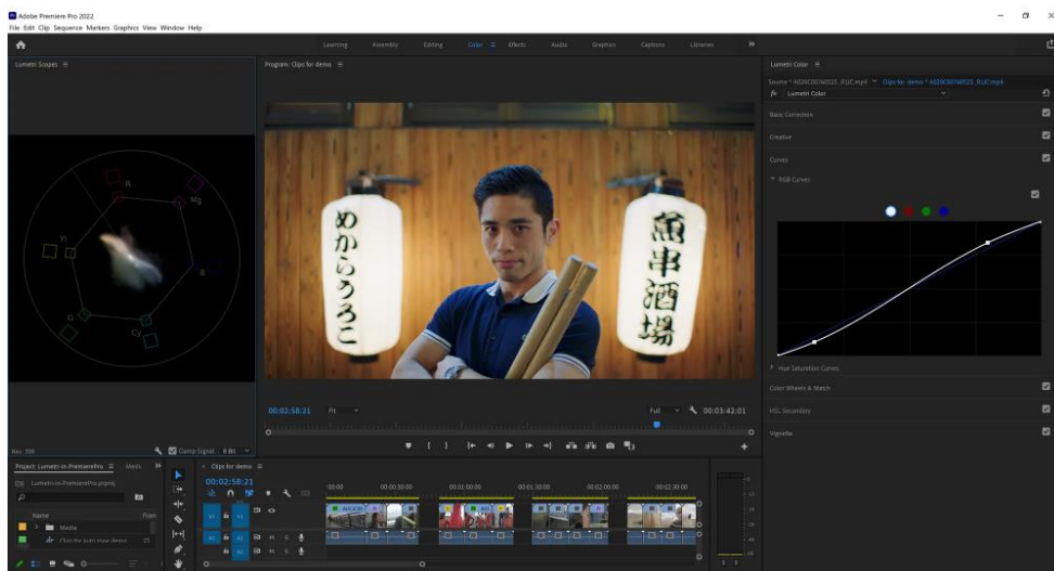
圖二：Premiere Pro 中的全新彩色向量示波器及更精緻的曲線。

Premiere Pro 在匯入和匯出影片時能正確地詮釋色彩空間素材。Lumetri 的改進亦包括以彩色向量示波器 (Colorized Vectorscope) 及更細緻的 RGB 和色相飽和度調整來簡化色彩工作流程。 10 Bit 422 HEVC 影片素材的硬體加速 可確保用戶在 Apple Silicon Mac 裝置和 Windows Intel 裝置上更順暢地播放這些格式。