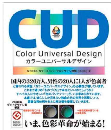
「カラーユニバーサルデザイン」 （カラーユニバーサルデザイン機構、ハート出版） 3,990円 2009年4月発行

欧米では日本よりも色弱者の割合が多く、見分けにくいデザインはすぐに指摘を受けるのでさほど問題にならないのです。一方、日本の色弱者は色覚検査で「異常扱い」をされながらも教育上の配慮はなされず、職業選択の障壁などもあって長く発言機会が閉ざされた状態でした。「色は世界中の誰が見ても同じなので、文字ではなく色で識別させよう」という色彩学者の言葉を真に受け、色弱者には識別できない路線図を作った鉄道会社の例もあります。かつて多くの鉄道会社では色弱者の就職が制限されていたので、社内に「おかしい」と思う人が少なかった。そんな日本特有の問題が、最近になってようやく知られるようになったのです。