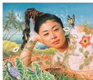
bird「極上ハイブリッド」 ©2002 Sony Music Associated Records Inc.