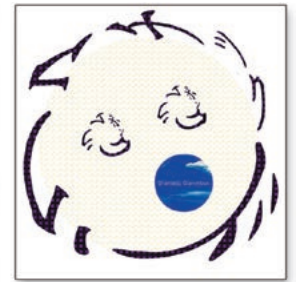
clammbon「ドラマチック」 ©2001 WARNER MUSIC JAPAN

アーティストとアルバムタイトルの文字をアウトライン化し、Illustratorの変形フィルタの組合せの発想によって生まれたデザイン