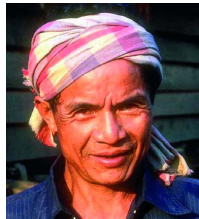
Rimpels snel weg met het retoucheerpenseel

nieuwe retoucheerpenseel gaat veel verder dan het kloongereedschap. Oorspronkelijke schaduwen, licht, kleuren en structuren blijven nu bewaard. Met het Reparatie-gereedschap kun je nog preciezer retoucheren door met selecties te werken. Retoucheren van foto's is met deze nieuwe gereedschappen een peulenschil geworden.