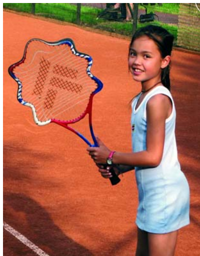
Leuke en flexibele effecten met het uitvloei filter.

als een preset opslaan en later weer gebruiken. Bezitters van een drukgevoelig tekentablet, zoals de bekende Wacom-tabletten, kunnen goed gebruikmaken van verschillende penseelinstellingen. Door de genoemde mogelijkheden is Photoshop nu ook interessant geworden voor traditionele tekentechnieken.