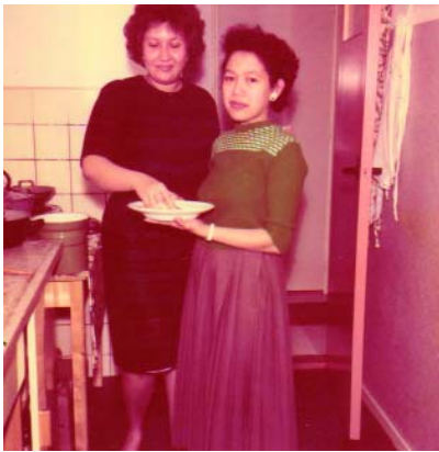
Een oude verkleurde foto is snel en goed opgeknapt met de functie Automatische kleuren