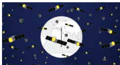
人工衛星の設計から打ち上げ、管制までが低価格で実現する特許技術を解説した動画「超低価格小型人工衛星」