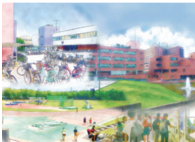
イラスト制作/芸術専門学群 八重樫 響

母体である東京教育大学の移転を契機に、1973年に「開かれた大学」「教育と研究の新しい仕組み」「新しい大学自治」を特色とした総合大学として開校。大学改革の先導的役割を果たしつつ、教育研究の高度化・大学の個性化を進め、国際競争力を持つ大学づくりを推進している。