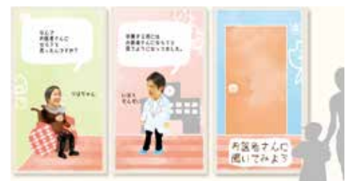
病院の待合室で公開されたモーショングラフィックス。入院児童が医師に、幼少期の夢などをインタビューしている