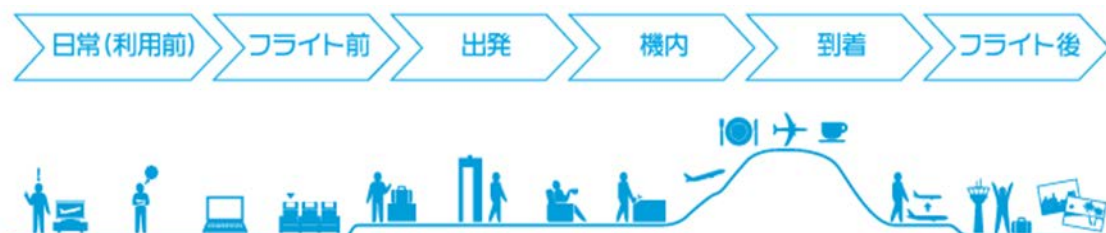
図1：ANAが提供するカスタマージャーニー

また、2016年11月に導入したAdobe Media Managerを以前より導入していた分析ソリューション「Adobe Analytics」、テストとターゲティングソリューション「Adobe Target」、オーディエンス管理ソリューション「Adobe Audience Manager」、マーケティングオートメーションソリューション「Adobe Campaign」と連携させることで消費者の分析データに基づいた、よりパーソナライズした広告展開が可能になります。すでに導入していたAdobe Experience Cloudソリューションとの連携がしやすいことや、プロフェッショナルサービスによる24時間365日対応のサポートが可能なのが強く評価されました。