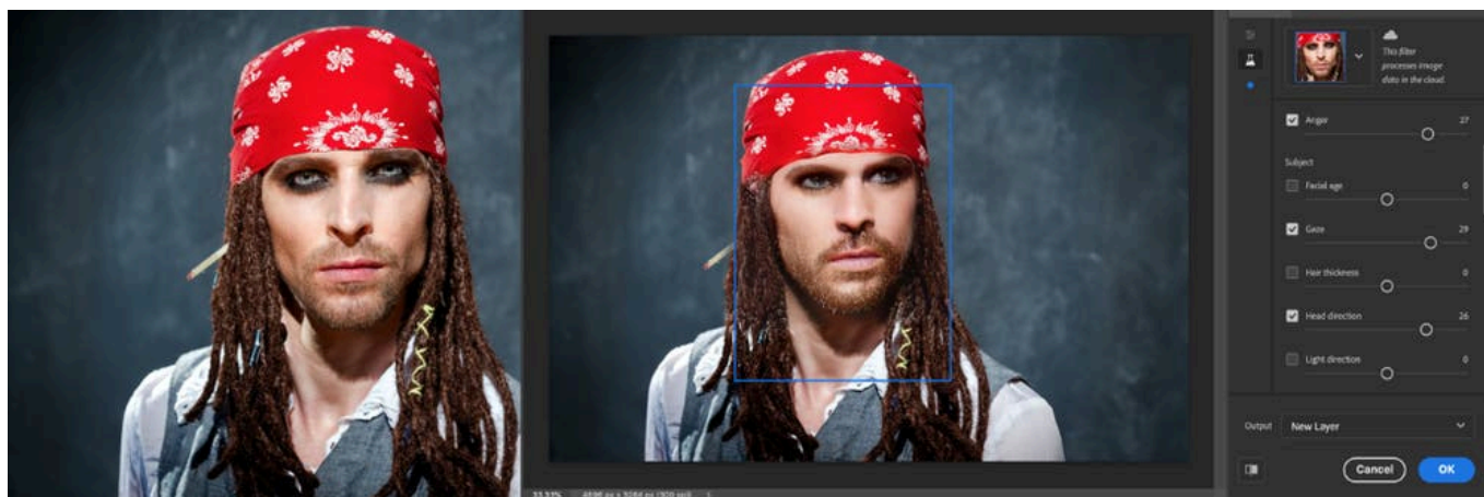
圖像 1：使用智能人像 (Smart Portrait) 濾鏡改變海盜頭部、眼睛的方向及表情

智能人像 (Smart Portrait) 是其中一款測試版濾鏡，可協助用戶改變人像的年齡、表情、姿勢、顏色等。人工智能技術將分析人像，並賦予用戶改變人像面部特徵的能力。他們可使用「凝視」和「頭部」滑桿改變人像眼睛或頭部的方向，或使用光線方向調整光源的角度。此外還能改變頭髮的厚度、微笑的強度，加點驚喜或憤怒，或使人像變老或變年輕。目前濾鏡在細微的變化上已取得理想的效果，但用戶還可繼續發揮自己瘋狂的想像力提升作品的創意。