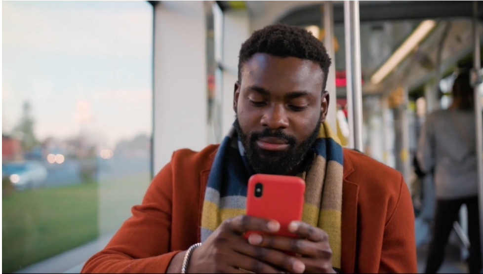
圖一：美國職業棒球大聯盟利用科技與數據來提升與球迷的互動方式，以建立更長遠的關係。

大聯盟的數碼平台將引入方便球迷的新功能，為每位球迷度身訂造的個人化促銷活動和通知。例如，為球場上的球迷顯示可快速前往座位的路線、VIP 泊車優惠或即時的折扣優惠。居住在喜愛球隊所屬地區以外的球迷也可收到來自球隊或球員到訪該區的消息。無論在家還是在旅途上，他們均可免費試用大聯盟官方直播網站 MLB.TV，在網站上觀看精彩賽事。