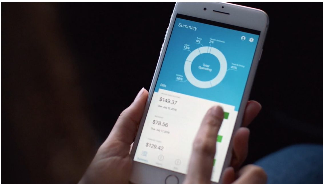
圖一：新一代 Adobe 即時 CDP 著重速度、信任度和與客戶關聯的體驗。

香港 — 2022 年 3 月 16 日 — 在 全球數碼體驗峰會 Adobe Summit 2022 ，Adobe (Nasdaq: ADBE) 宣布 Adobe 即時 CDP (客戶資料平台) 的創新功能以及新客戶。Adobe 即時 CDP 現已成為零售、醫療保健、金融服務、科