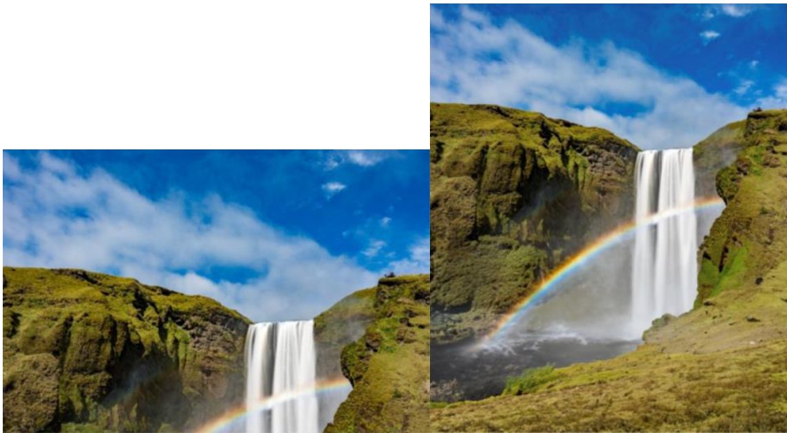
生成式擴展使用前 (左) 與使用後 (右)

生成式擴展讓用戶能使用裁切工具無縫延伸圖像。若圖像主體被切掉、影像長寬比不符合需求、或對焦物件和其他部分不協調，用戶即可使用生成式擴展輕鬆延伸畫布，讓圖像完美呈現符合他們所期待的效果。