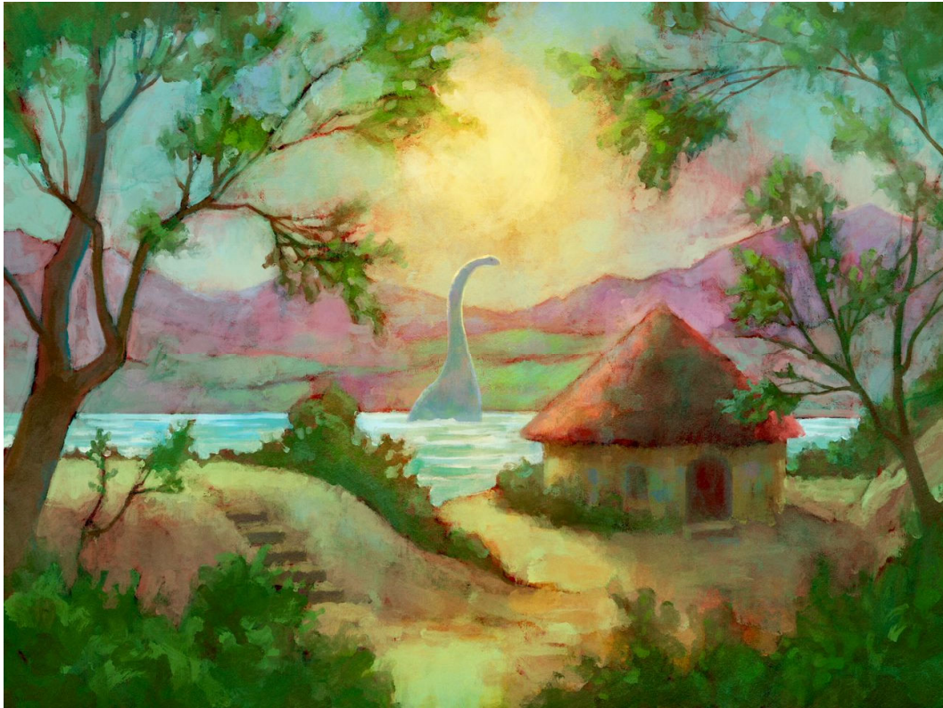
繪畫 3: Photoshop 筆刷