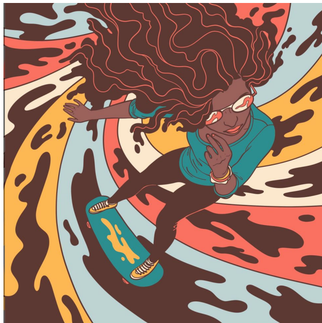
繪畫 4: 向量筆刷