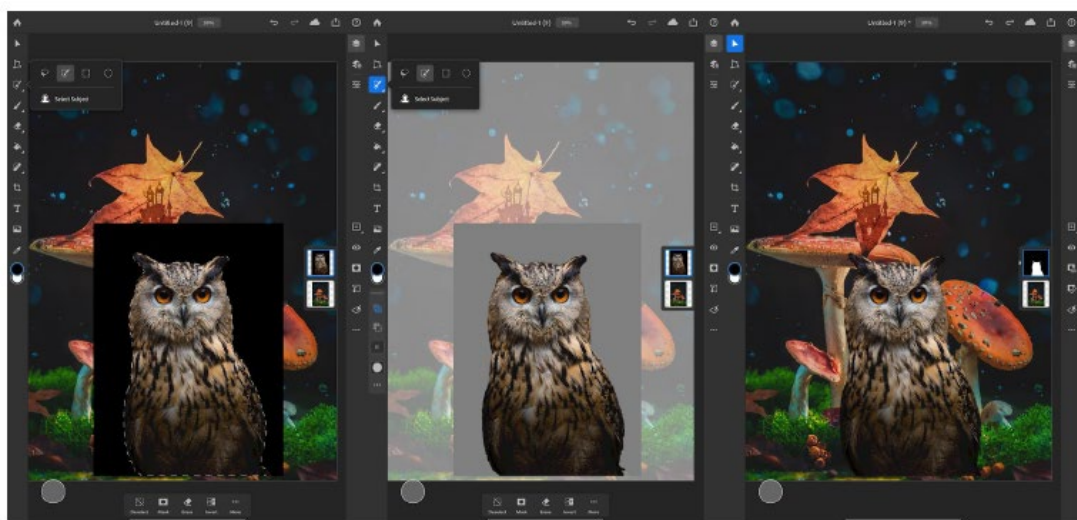
圖 2：用戶只需在螢幕輕按點選，就能選取影像中最突出的主體，方便用戶作後續處理。