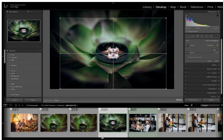
圖 3：當使用方形裁切或期望將焦點集中至相片的中心位置時，這項居中剪裁的新功能特別有用。